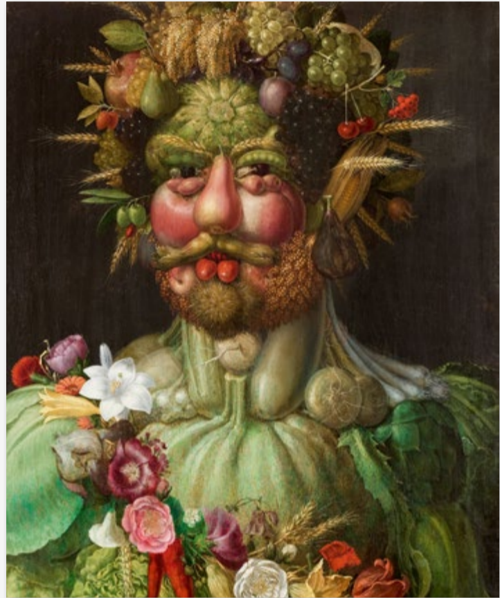
Retrato de Rodolfo II en traje de Vertumno, de Arcimboldo.